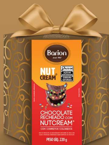
OVO AO LEITE COM NUTCREAM ® COM CONFEITOS COLORIDOS 220 g