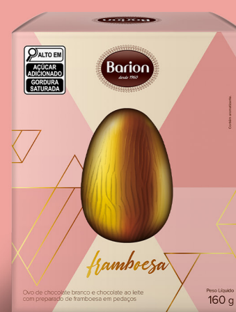
OVO FRAMBOESA OVO DE CHOCOLATE BRANCO COM PEDAÇOS DE FRAMBOESA E CAMADA INTERNA DE CHOCOLATE AO LEITE 160 g