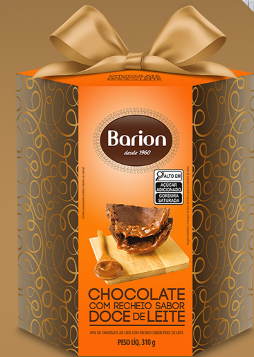
OVO AO LEITE COM DOCE DE LEITE 310 g