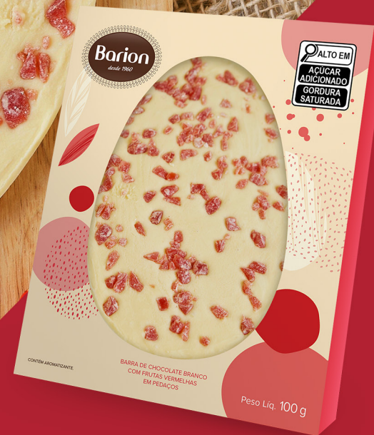
OVO 2D FRUTAS VERMELHAS BARRA DE CHOCOLATE BRANCO COM FRUTAS VERMELHAS 100 g