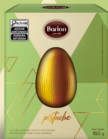
OVO PISTACHE OVO DE CHOCOLATE BRANCO COM RECHEIO DE PISTACHE E PISTACHE EM PEDAÇOS 160 g