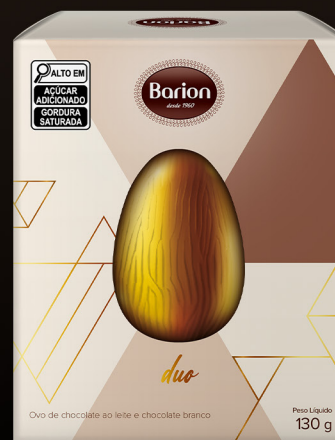
OVO DUO OVO DE CHOCOLATE BRANCO E CHOCOLATE AO LEITE 130 g