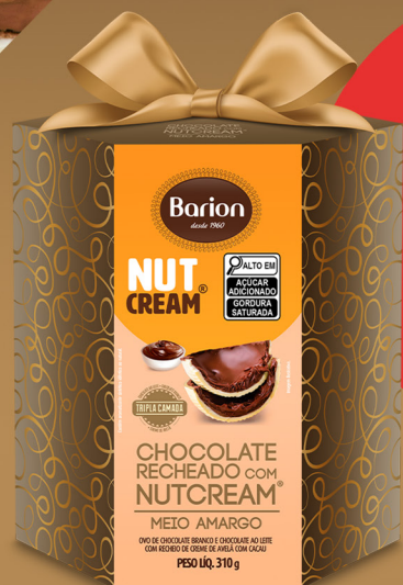
OVO BRANCO E AO LEITE COM NUTCREAM ® 310 g