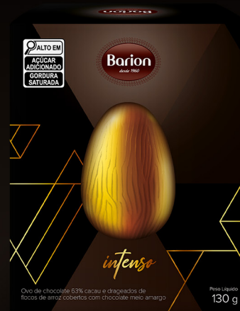
OVO INTENSO OVO DE CHOCOLATE 63% CACAU 130 g