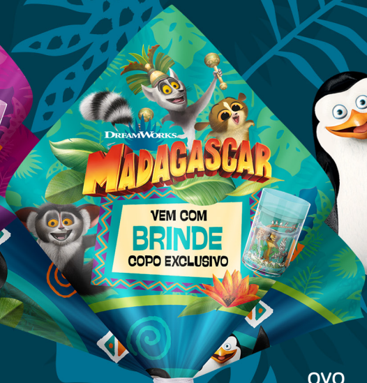
OVO MADAGASCAR MENINOS COM COPO DE BRINDE 100 g