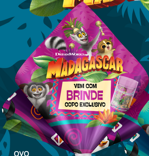
OVO MADAGASCAR MENINAS COM COPO DE BRINDE 100 g