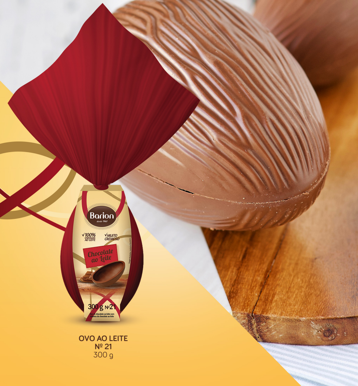
OVO AO LEITE Nº 21 300 g