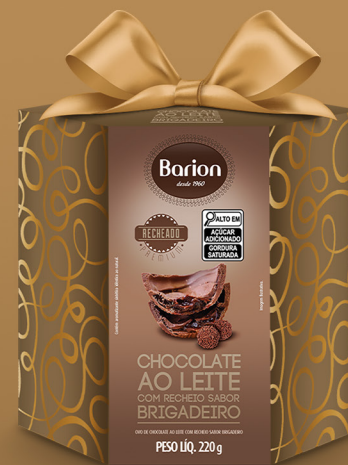
OVO AO LEITE COM BRIGADEIRO 220 g