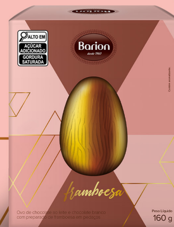
OVO FRAMBOESA OVO DE CHOCOLATE AO LEITE COM PEDAÇOS DE FRAMBOESA E CAMADA INTERNA DE CHOCOLATE BRANCO 160 g