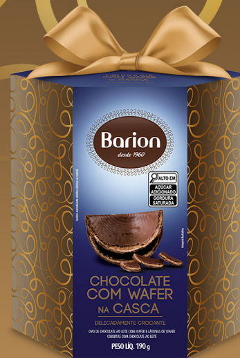
OVO AO LEITE COM WAFER 190 g