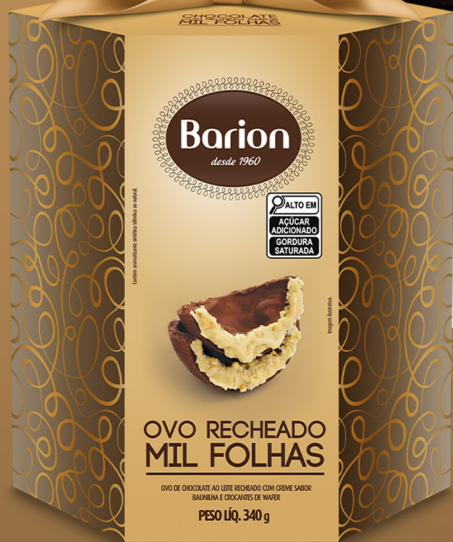
OVO AO LEITE MIL FOLHAS 340 g