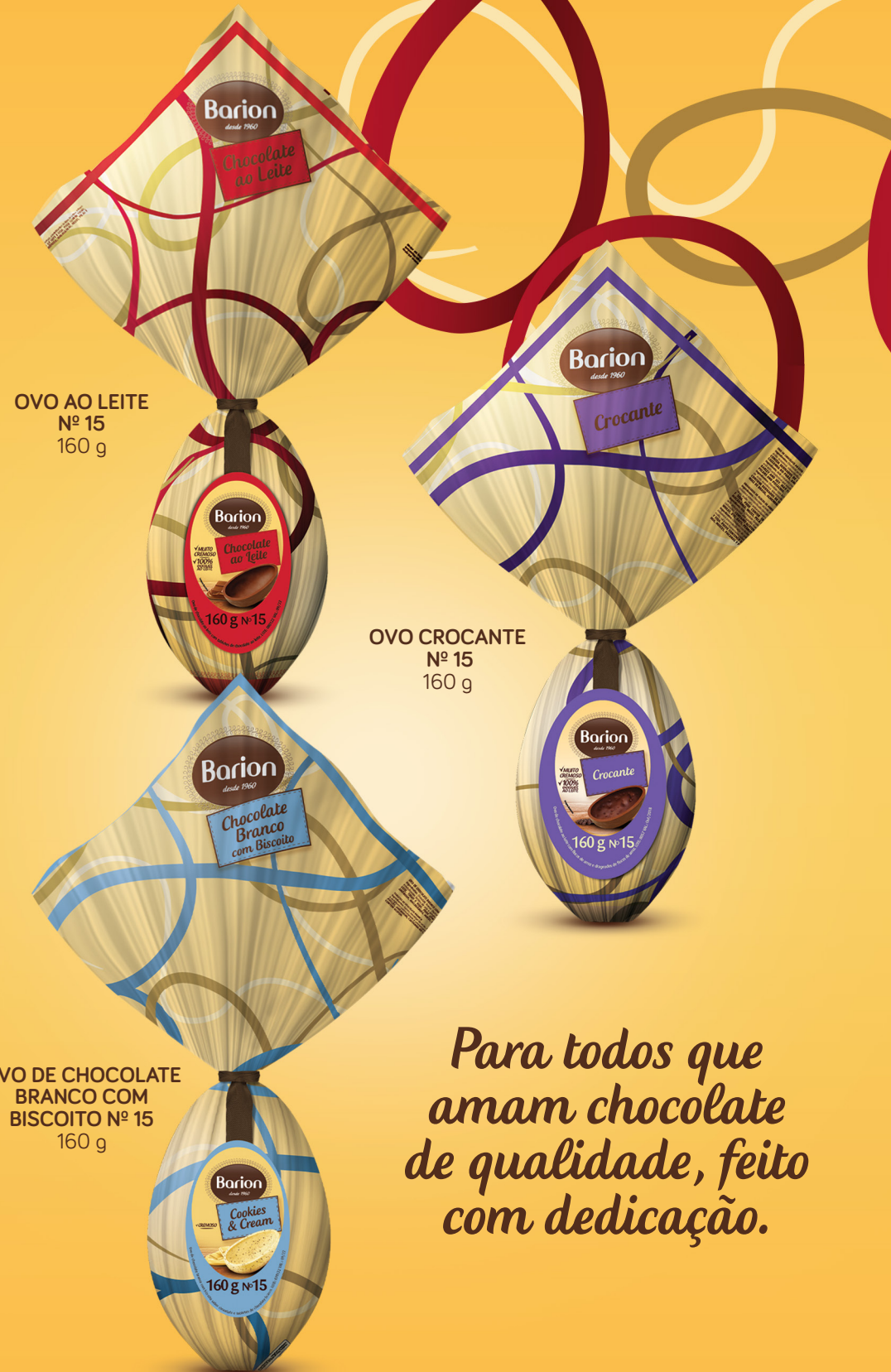
OVO AO LEITE Nº 15 160 g