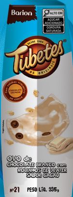
OVO BRANCO COM TUBETES® N° 21 335 g