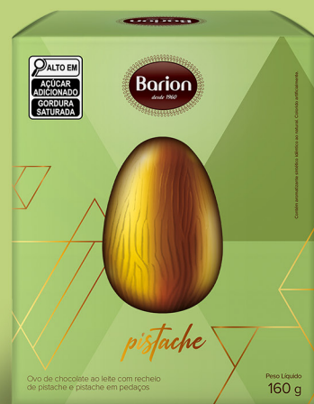
OVO PISTACHE OVO DE CHOCOLATE AO LEITE COM RECHEIO DE PISTACHE E PISTACHE EM PEDAÇOS 160 g