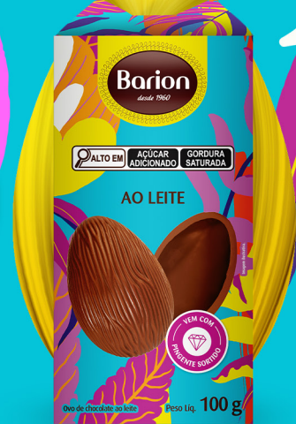
OVO TEENS OVO DE CHOCOLATE AO LEITE COM PINGENTE SORTIDO 100 g