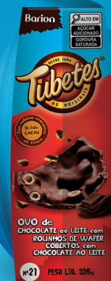
OVO AO LEITE COM TUBETES® CHOCOLATE N° 21 335 g