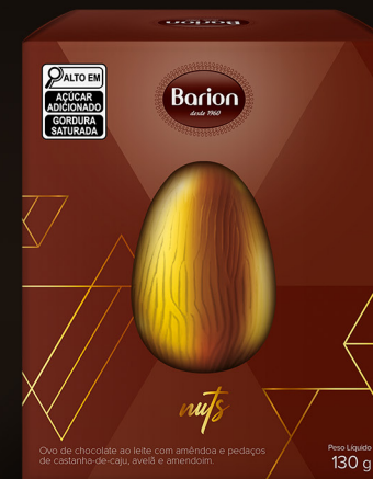
OVO NUTS OVO DE CHOCOLATE AO LEITE COM AMÊNDOA E PEDAÇOS DE CASTANHA-DE-AJU, AVELÃ E AMENDOIM 130 g