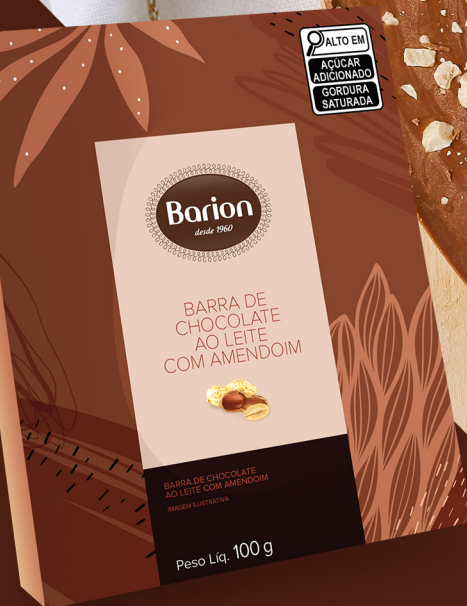
OVO 2D AMENDOIM BARRA DE CHOCOLATE AO LEITE COM AMENDOIM 100 g